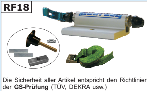
Die Sicherheit aller Artikel entspricht den Richtlinien der GS-Prüfung (TÜV, DEKRA usw.)